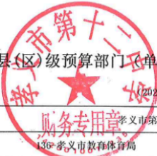
孝义市县(区)级预算部门(单位)项目支出绩效目标表