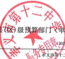
孝义市县(区)级预算部门(单位)项目支出绩效目标表