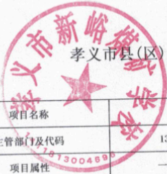
孝义市县(区)级预算部门(单位)项目支出绩效目标表