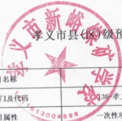
孝义市县(区)级预算部门(单位)项目支出绩效目标表 (2026年度)