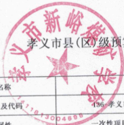
孝义市县(区)级预算部门(单位)项目支出绩效目标表