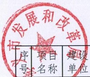
发改局2021年5月办理项目情况统计表