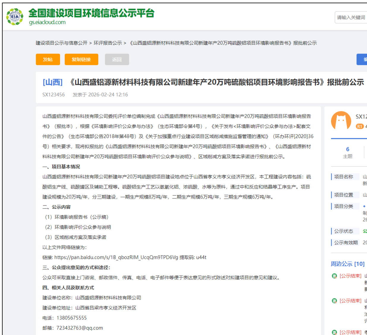
图 6 网站报批前公示