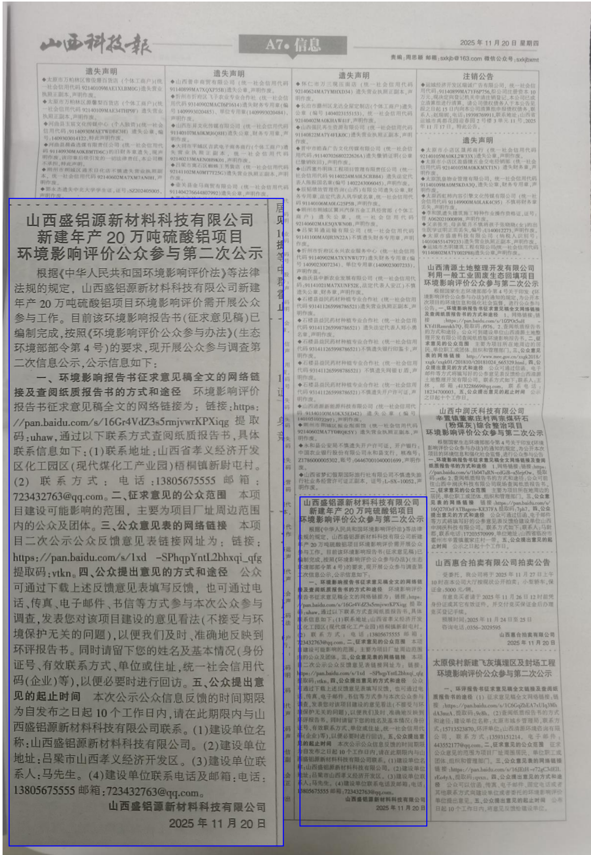
图 4 环境影响评价公众参与第二次公示（报纸公示，2025 年 11 月 20 日）