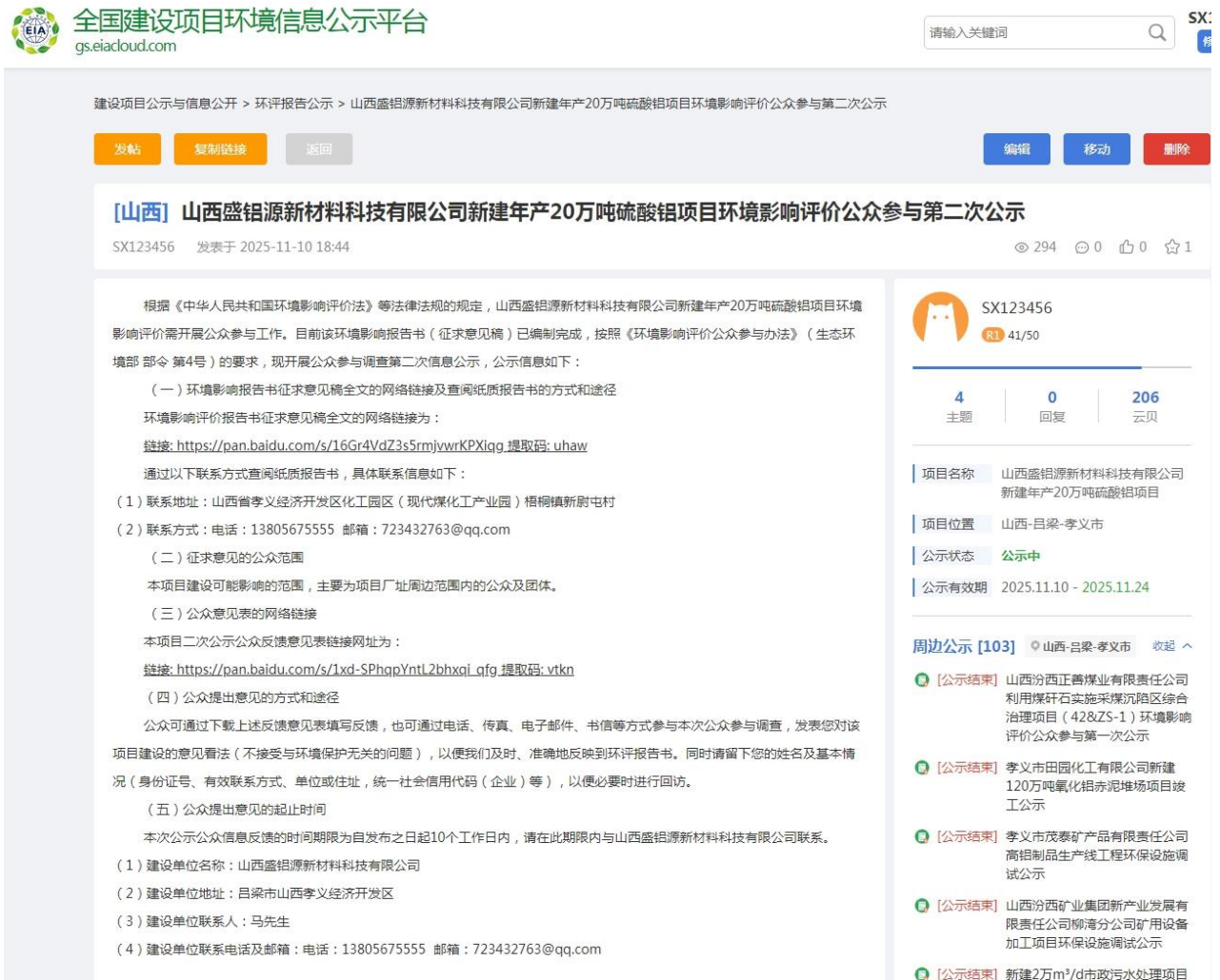
图 2 环境影响评价公众参与第二次公示（网络公示） （网址： https://www.eiacloud.com/gs/detail/1?id=51110rT4dC ）