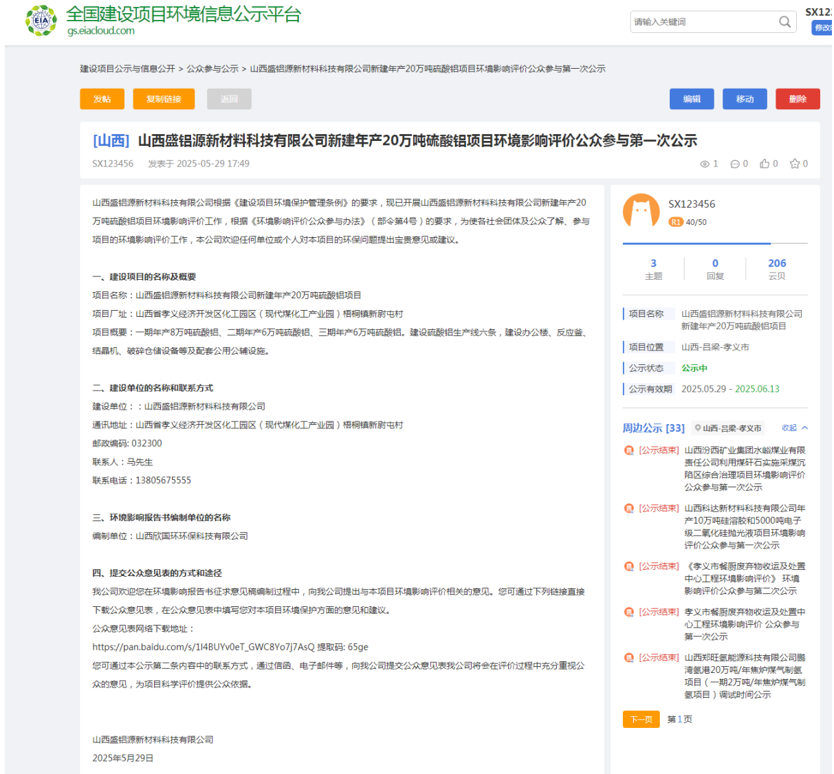
图 1 本项目环境影响评价公众参与第一次公示 (网址: https://www.eiacloud.com/gs/detail/3?id=505290iXWY )