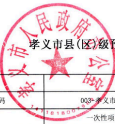
孝义市县(区)级预算部门(单位)项目支出绩效目标表