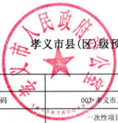
孝义市县(区)级预算部门(单位)项目支出绩效目标表