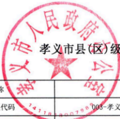
孝义市县(区)级预算部门(单位)项目支出绩效目标表