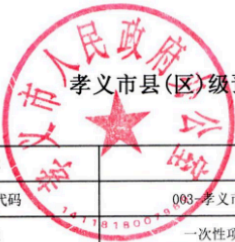
孝义市县(区)级预算部门(单位)项目支出绩效目标表