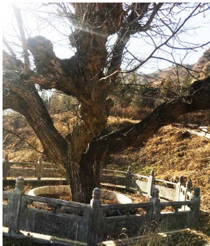
具有680多年树龄的孝义核桃树王

孝义所产核桃，其核仁味道甘美，富含脂肪和蛋白质，不论生食或制成糕点、糖果，均清香可口；还是一种益智健脑食品，能补气益血，润燥化痰，治肺润肠，味甘性平，有一定的温补肾肺，定喘化痰疗效。截至2010年，总生产面积达1.2万公顷，年生产总量达3500吨。除了核桃仁的多种开发利用之外，还可制作核桃油、核桃饮料，市场开发空间大，附加值高。2008年获中华人民共和国农产品地理标志产品保护。