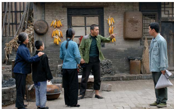
碗碗腔音乐电视《酸枣坡》剧照