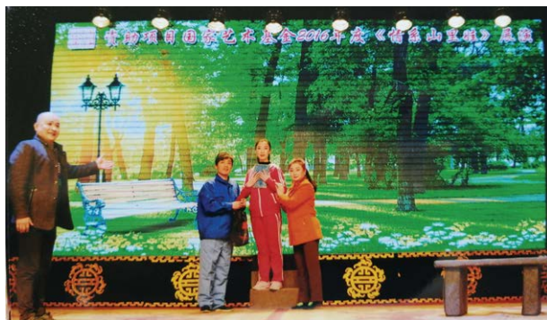
碗碗腔现代戏《情系山里娃》剧照