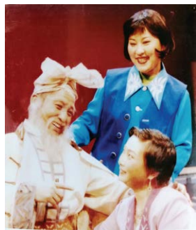
碗碗腔《风流姐妹》剧照

2019年5月24日，孝义市民间艺术剧院（研究院）与孝义市职业教育中心合作成立全市首个“非遗实践基地”，让国家级非遗文化走进校园，有效引导未成年人感受传统文化的魅力，激发他们对非遗传承保护的热情，对全市非遗传承人的培养起到了积极推动作用。