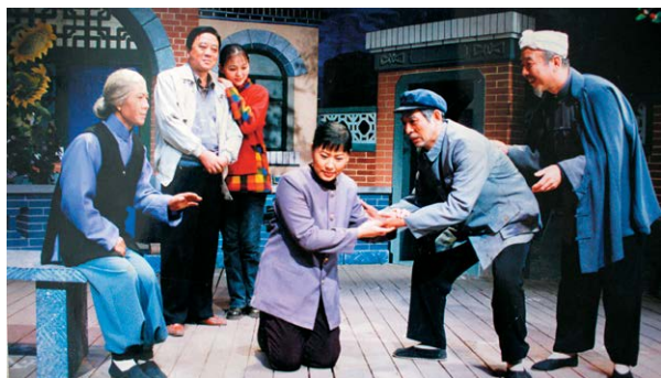
碗碗腔《风流父子》剧照