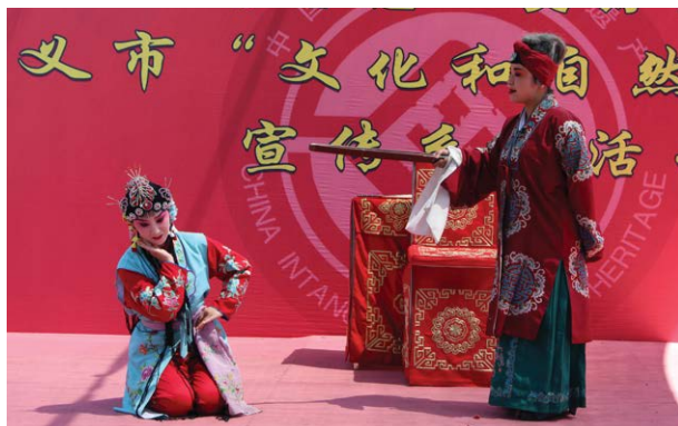
碗碗腔《三娘教子》剧照